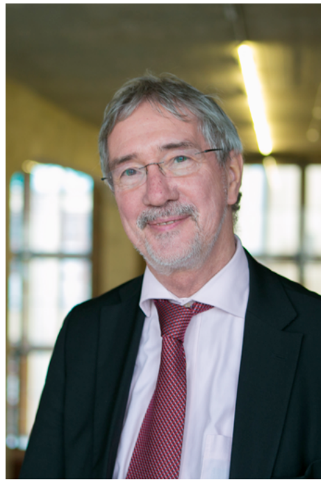
ФОТО: АЛЕНА КОНОРДИНА ДЛЯ РБК

связей между Северным Рейном-Вестфалией в прошлом году составлял €7,1 млрд, в 2014-м было €9,7 млрд. Здесь мы действительно наблюдаем драматический спад. Но мне кажется, что сейчас все идет к тому, чтобы это падение остановилось.