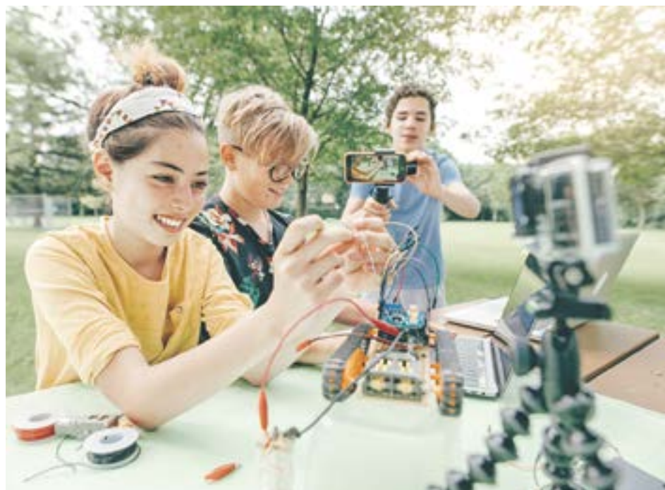
Многие языковые школы расширяют свои программы. Появляется все больше курсов, связанных с робототехникой и программированием

Дополнительную безопасность должны обеспечить камеры наблюдения снаружи и внутри школы. Кроме того, дети ни на минуту не остаются без присмотра: рядом с ними постоянно находятся наставники и дежурный персонал, поясняет Наталия Бондарева. Они же следят и за настроениями внутри коллектива: в случае конфликтов между детьми организаторы ставят в известность родителей и постараются выправить ситуацию, не пуская ее на самотек. Не укроются от их взгляда и более нежные чувства между подростками. «Мы не запрещаем отношения между мальчиками и девочками, пока они не переходят нормы. Но находиться в комнате, где живут дети другого пола, у нас запрещено: за этим ночью следят