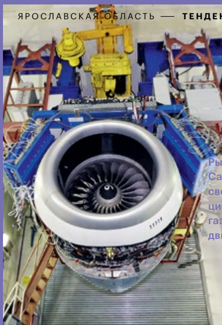
Рыбинский «ОДК-Сатурн» замещает своей продукцией импортные газотурбинные двигатели