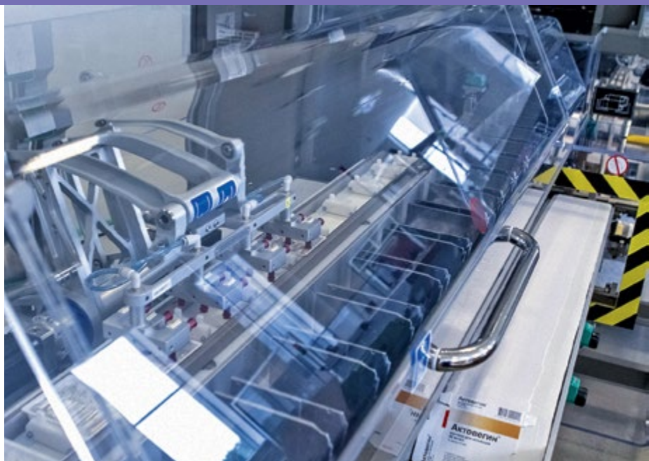
Ярославский фармкластер с производством полного цикла обеспечит страну высокотехнологичным сырьем для выпуска лекарств

Ярославской области за последние девять лет удалось создать один из самых успешных фармкластеров. По данным Минпромторга, наряду с калужским