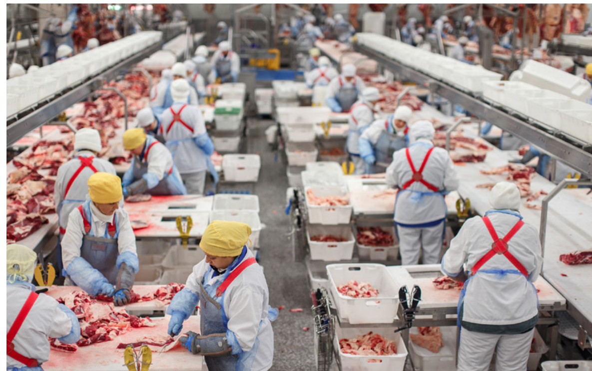
↑ Из каждой туши получается более ста различных отрубов