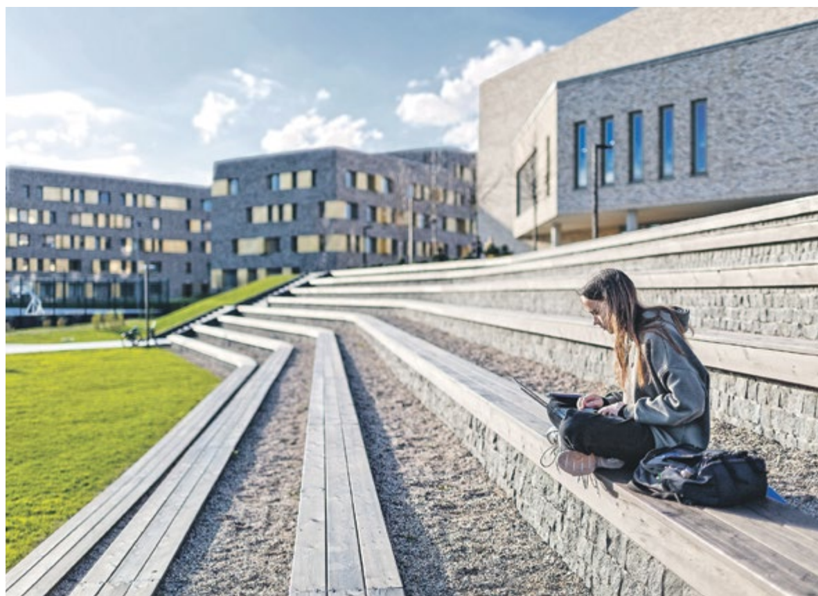
← К 2030 году работодатели будут ожидать от сотрудников в первую очередь умения решать проблемы (problem solving), цифровой грамотности и способности к автономному обучению

Необходимо закладывать навыки, которые позволят заниматься инновациями и ис-