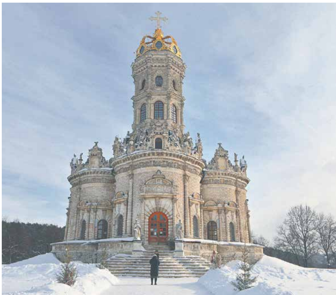
← Туристов в Подмосковье интересуют прежде всего культурные и исторические объекты. Храм Знамени Пресвятой Богородицы в Дубровицах

Коломна, которую за тот же период посетило 1,3 млн туристов.