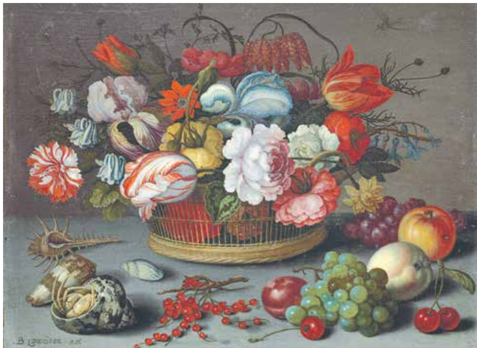
← Некоторые картины на выставке «Образ и смысл» в прямом смысле проиллюстрированы запахами. Балтазар ван дер Аст, «Корзина с цветами» (1622)

Сегодня любители европейской живописи не могут так легко, как прежде, насладиться работами любимых художников. Но Европа становится ближе благодаря стараниям музейщиков.