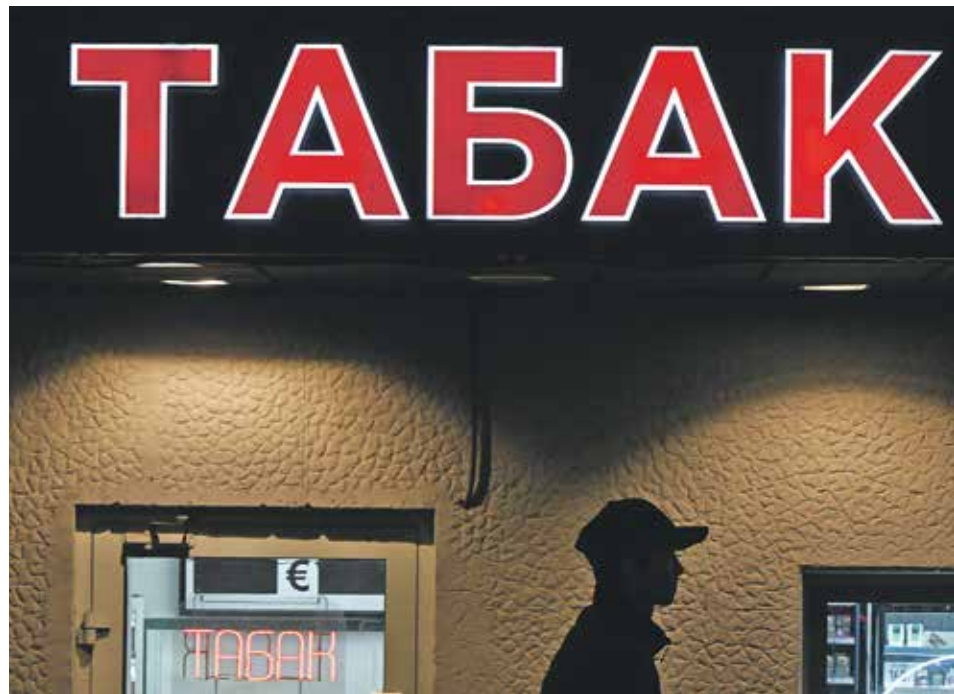
← Контрабанда сигарет, по оценкам ННЦК, занимает больше половины всего объема черного рынка

Однако остается и другая часть проблемы — масштабная контрабанда сигарет, занимающая, по оценкам ННЦК, больше половины всего объема черного рынка. 70% в цене табачных изделий в РФ занимает налоговая составляющая. При этом за семь лет ставки акци-