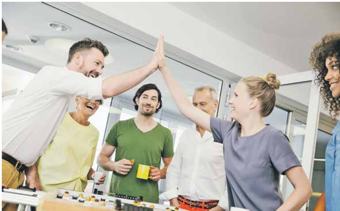
↑ Рынок труда во многих сферах все еще остается «рынком кандидата»

В условиях дефицита специалистов на рынке труда компании уделяют все больше внимания сохранению персонала и созданию траекторий карьерного развития.